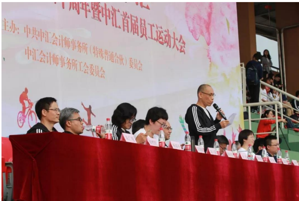
▲余所宣布运动会开幕