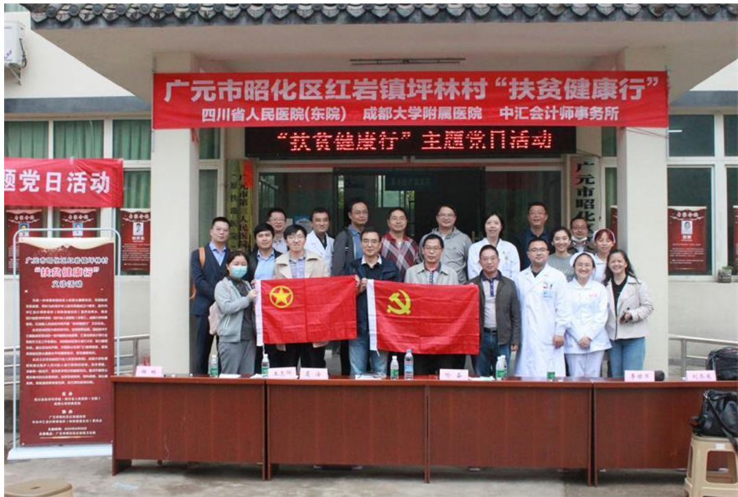
义诊活动工作人员合影